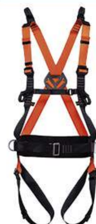
Cinturão Mult 2010A MG Cinto