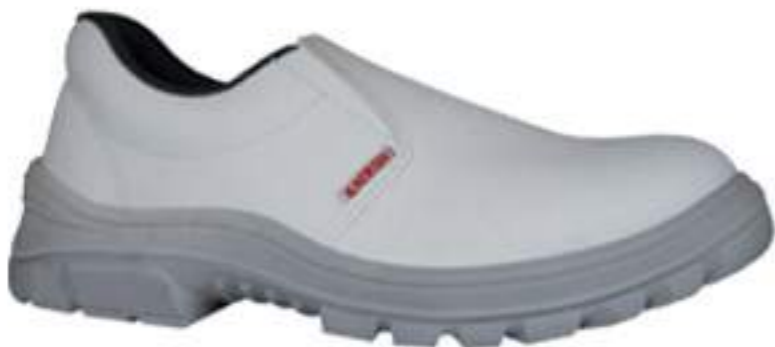
Sapato Kadesh Microfibra CA 40886