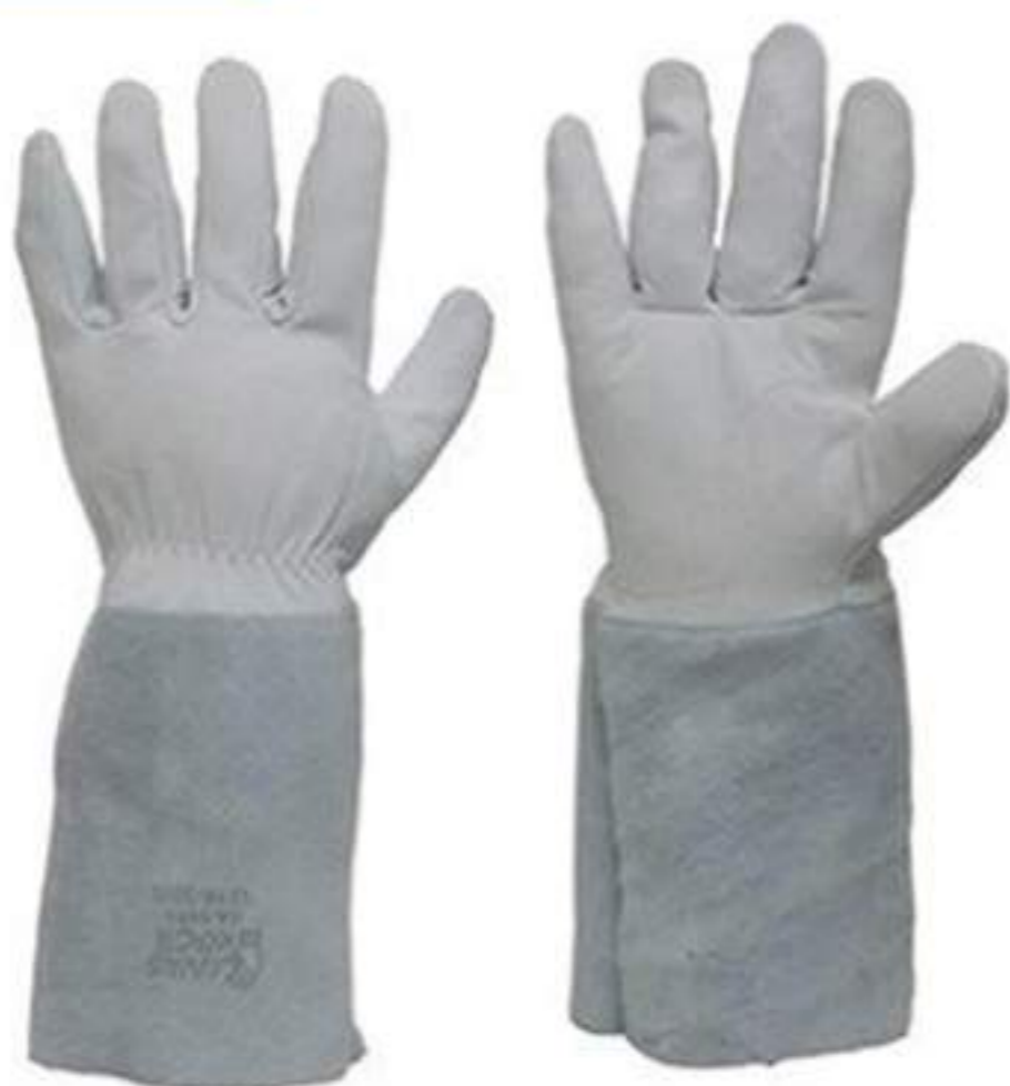
Luva de Vaqueta punho 15