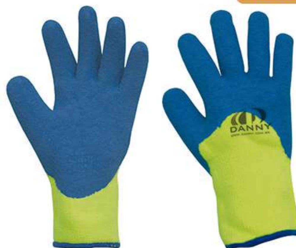
Luva Danny Polarflex CA 21252