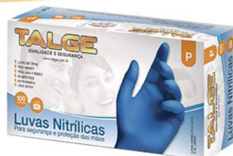
Luva Talge Nitrílica CA 29509