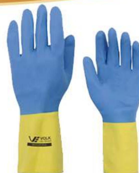
Luva Volk Neoprene Bicolor CA 16779