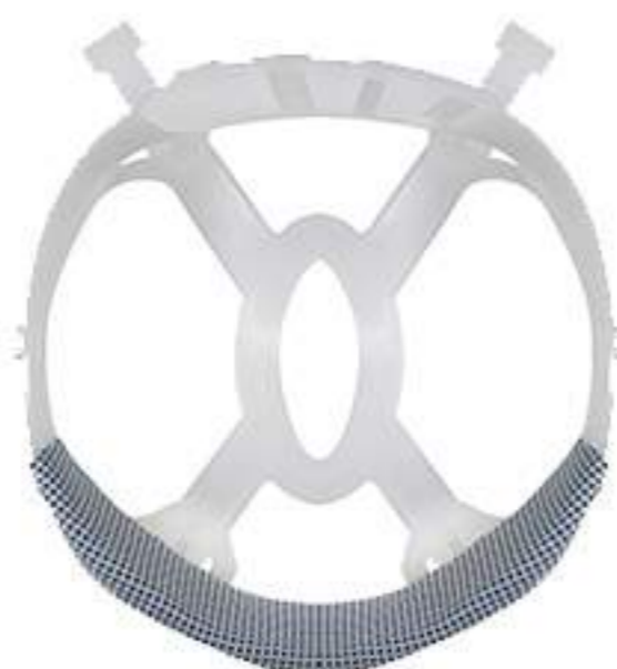
Suspensão de Plástico Camper