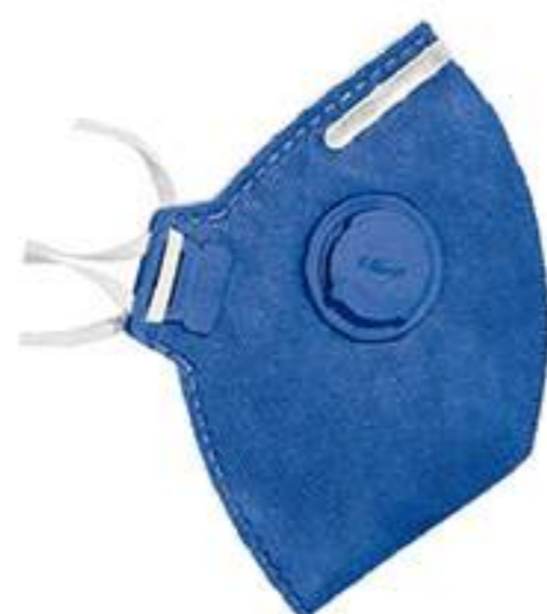
Respirador Tayco PFF2-V carvão ativado