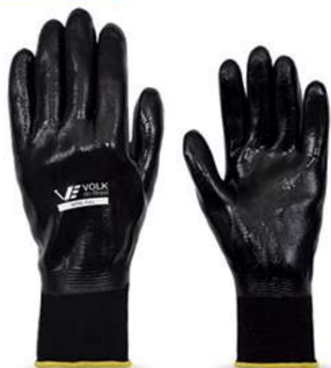
Luva Volk Nitril Full CA 25280