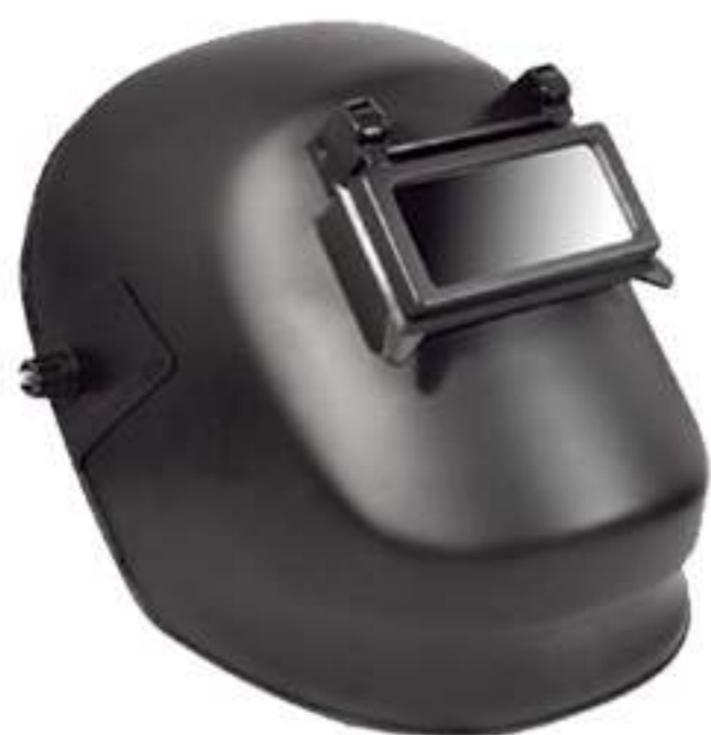
Máscara de solda Carbografite Advanced