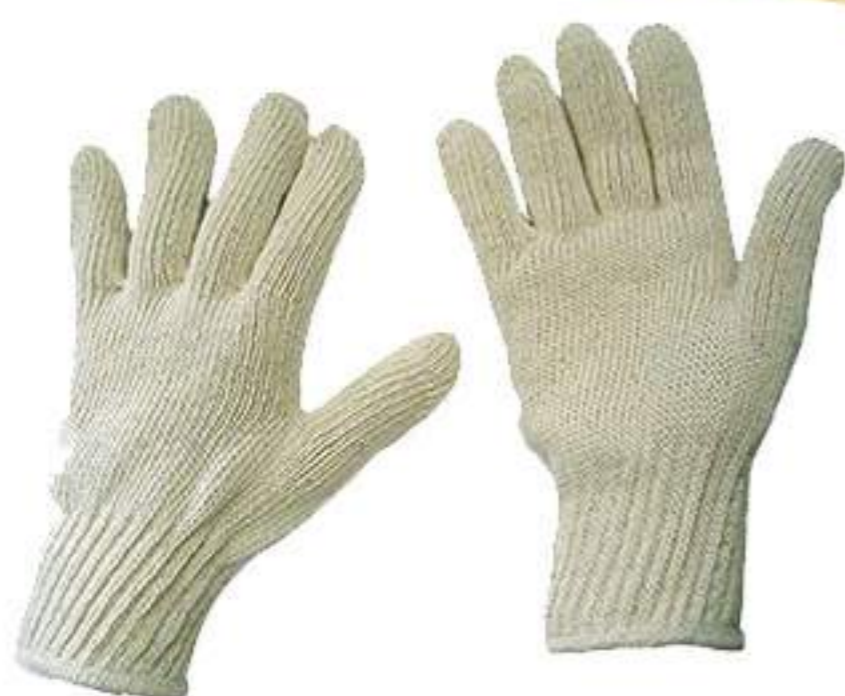
Luva de Malha 4 Fios Branca CA