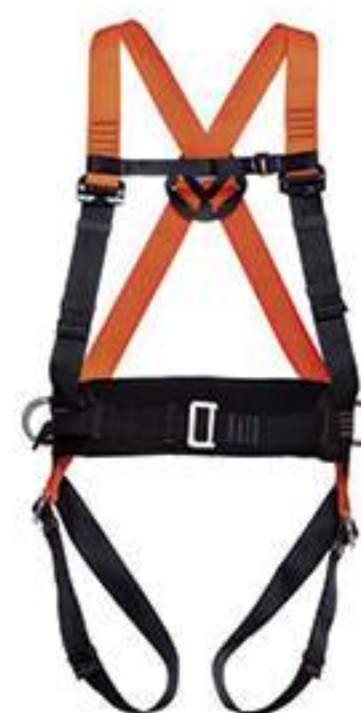
Cinturão Mult 2010C MG Cinto