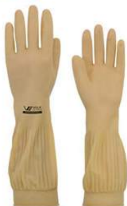
Luva Volk Ranhurada CA 15100