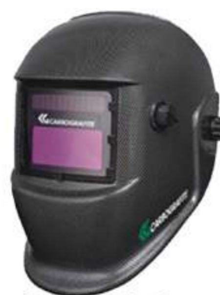
Máscara Carbografite de Autoescurecimento