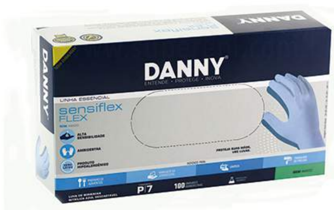
Luva Danny Sensiflex Flex CA 25091