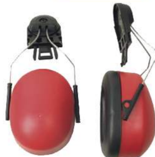
Abafador Carbografito CG 108