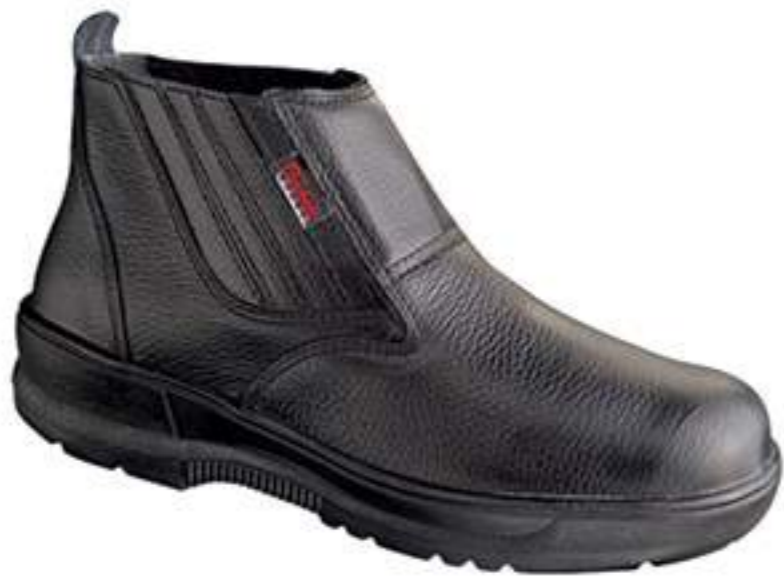
Botina Conforto CA 7238