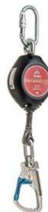
Travaquedas Mult 2016A MG Cinto