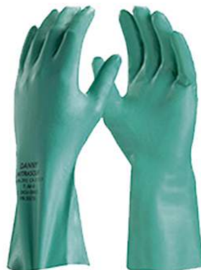
Luva Danny Nitrasolv Verde Forrada CA 25313