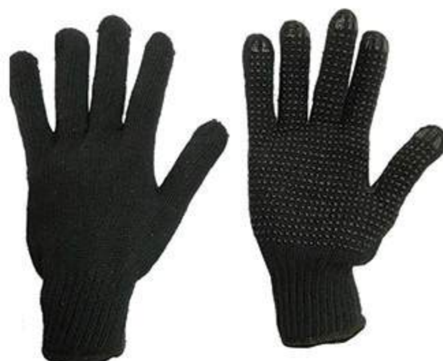
Luva SS PIG