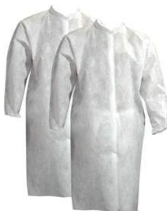
Avental de Procedimento Descartável