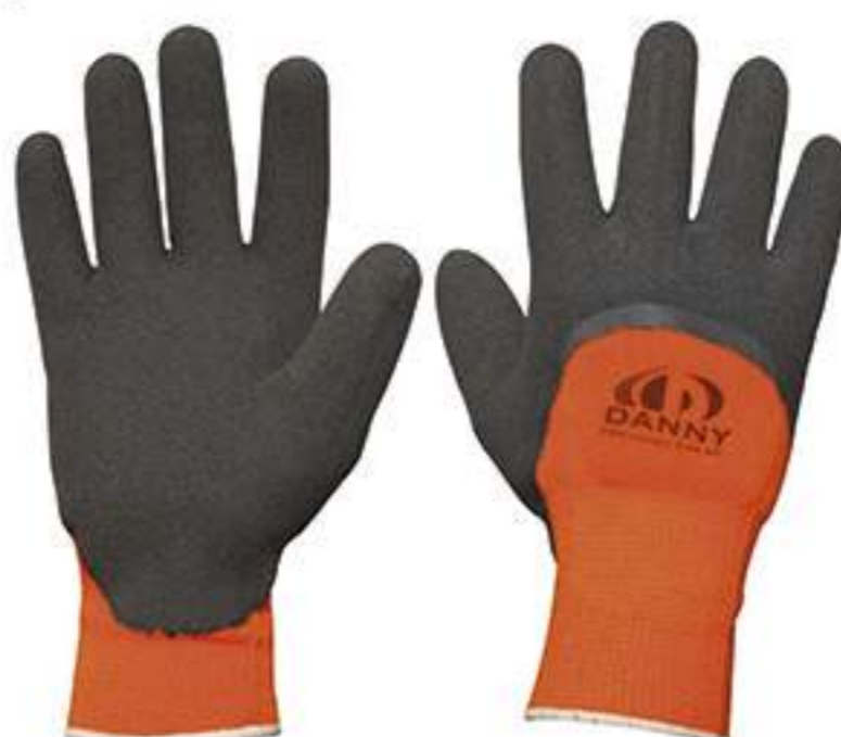
Luva Danny Maxitherm CA 28579