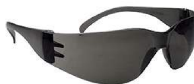
Óculos Danny Águia Fumê