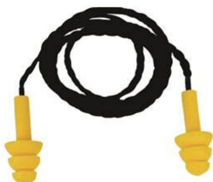
Protetor Auricular Maxxi Royal