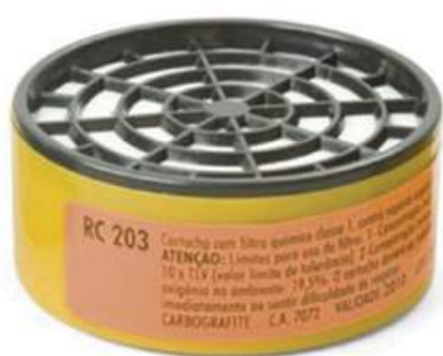
Filtro Carbografite RC 203