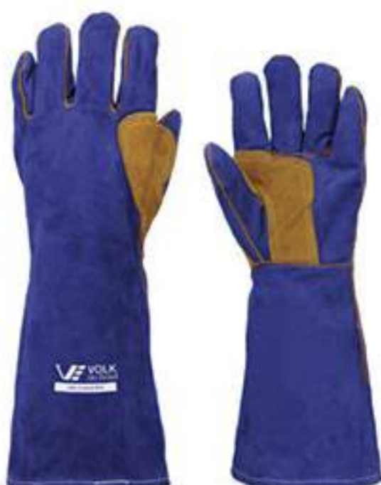
Luva Volk Weld Master CA 19894