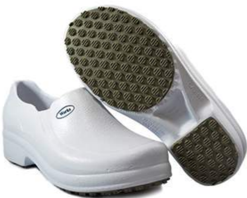
Sapato BB65 Branco Soft Works CA 31898