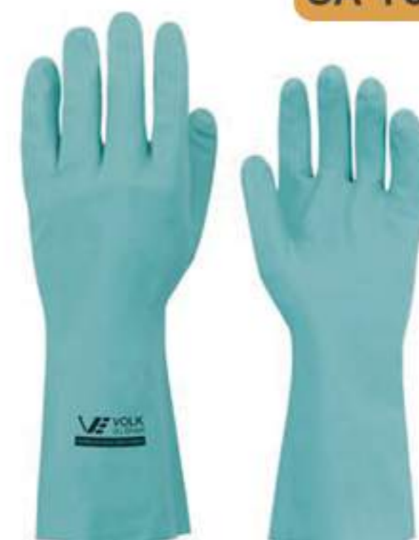
Luva Volk Nitrílica CA 16314