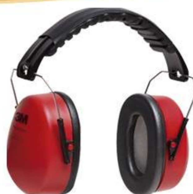
Abafador 3M Muffler