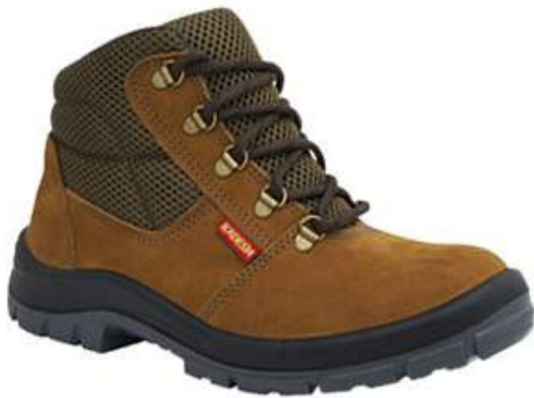
Botina Kadesh Nobuck CA 16252