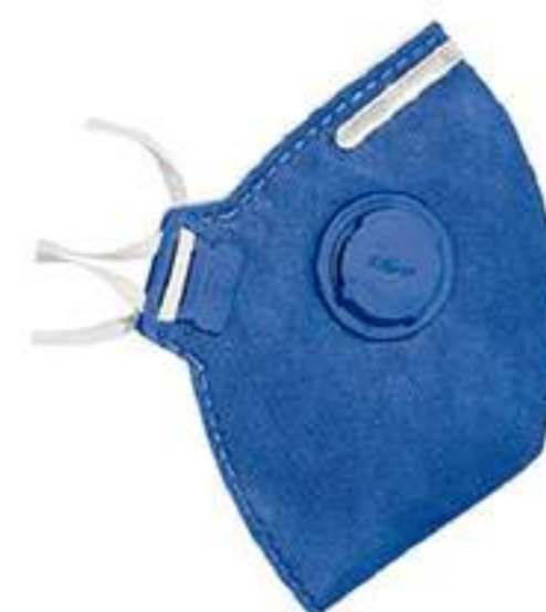
Respirador Tayco PFF3-V