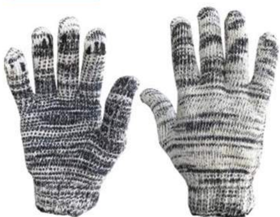
Luva de Malha 6 Fios Mescla CA