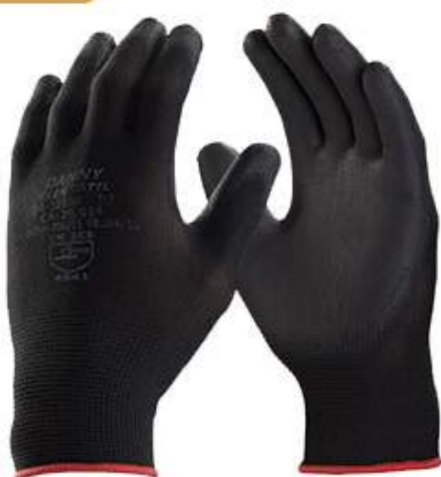
Luva Danny Flextátil CA 29014