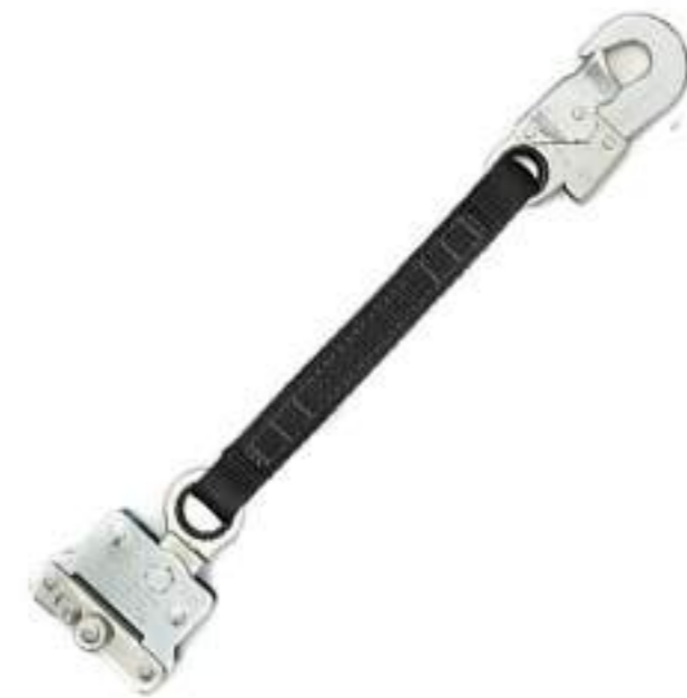
Travaquedas Mult 1886A MG Cinto