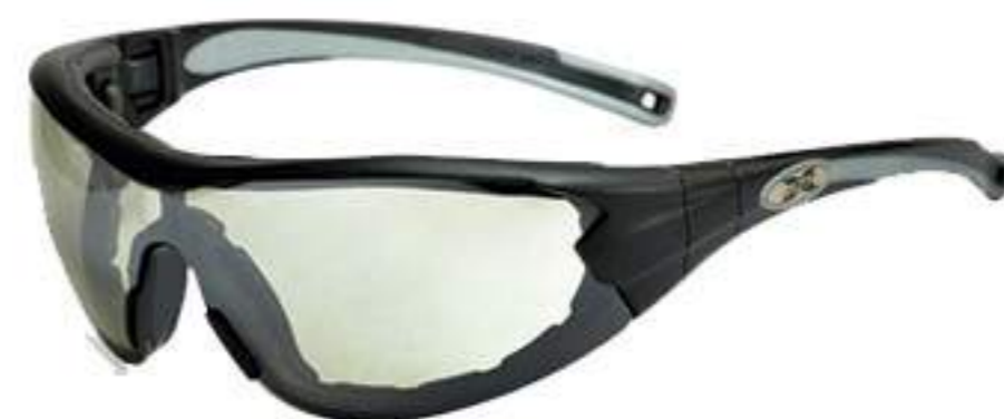
Óculos Vicsa Delta CA 27772