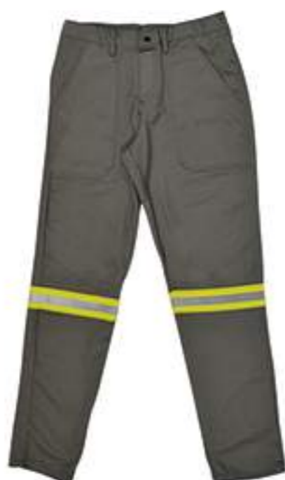
Calça NR-10 Cinza com OU sem Refletivo