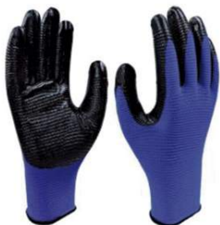
Luva SS 1006 N