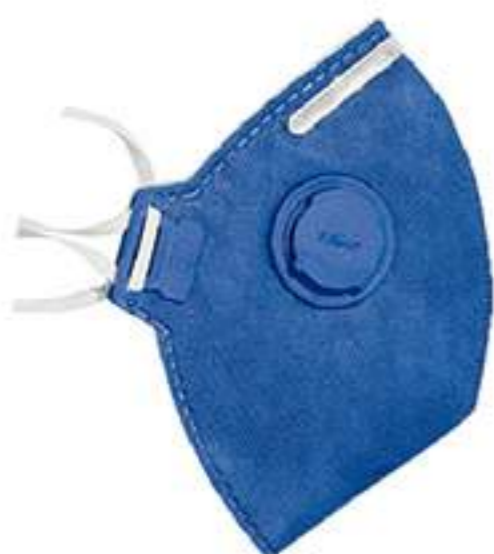
Respirador Tayco PFF2-V