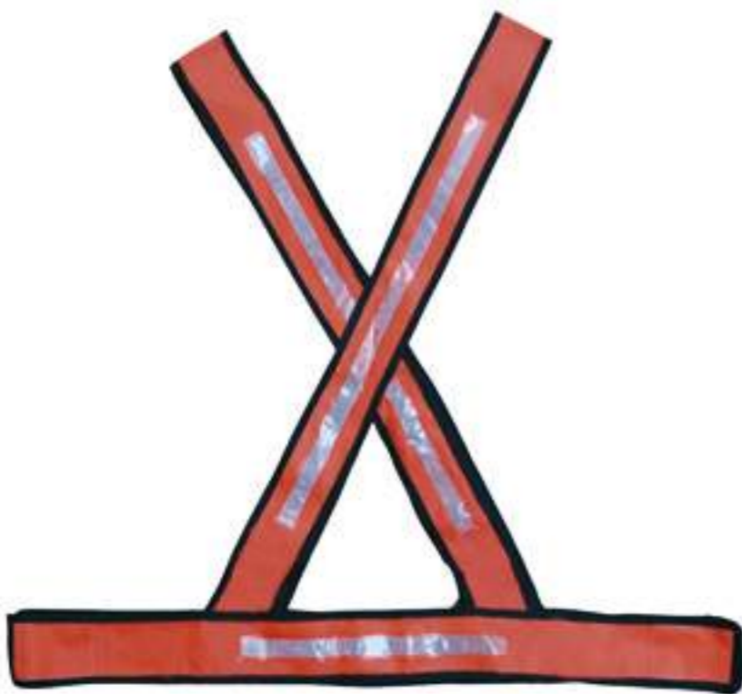
Colete Refletivo em X LJ