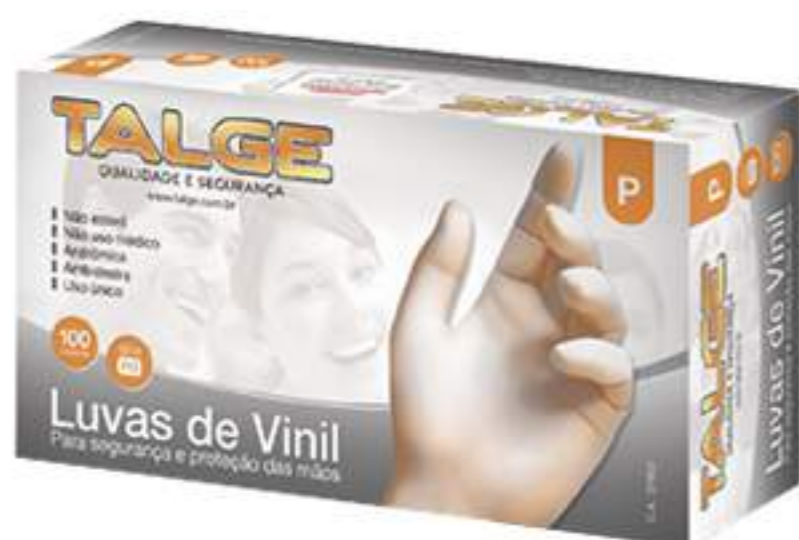
Luva Talge Vinil CA 37215