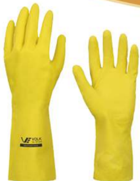
Luva Volk Multiuso AM CA 10695