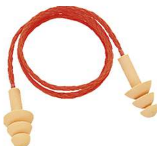
Protetor Auricular Deltaplus