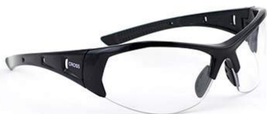
Óculos Vicsa Cross CA 27777