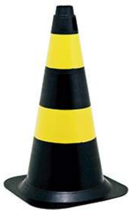
Cone 75 cm PT-AM Rígido