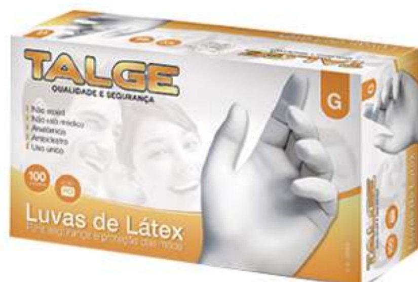
Luva Talge Látex C-PÓ CA 28324