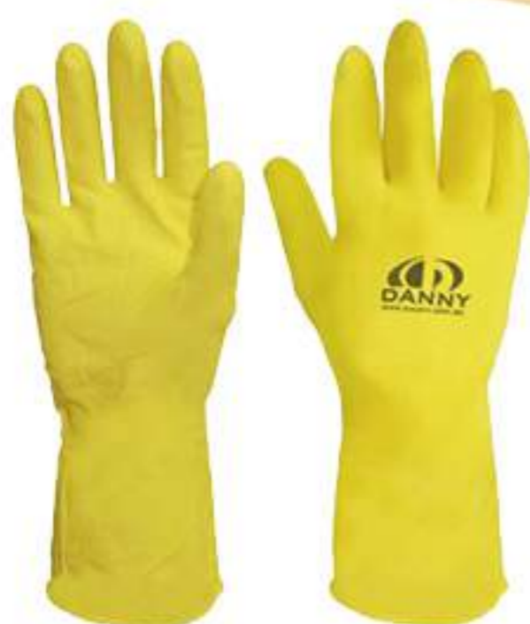
Luva Danny Confort Látex CA 15532