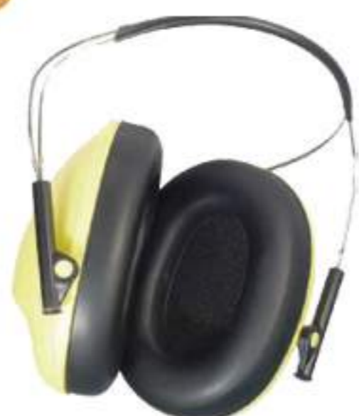
Abafador Carbografito CG 109