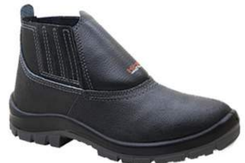
Botina Kadesh Bidensidade CA 17010