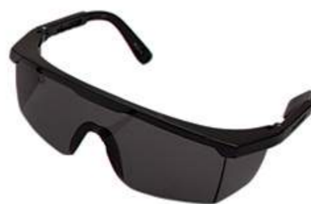
Óculos Danny Fênix Fumê