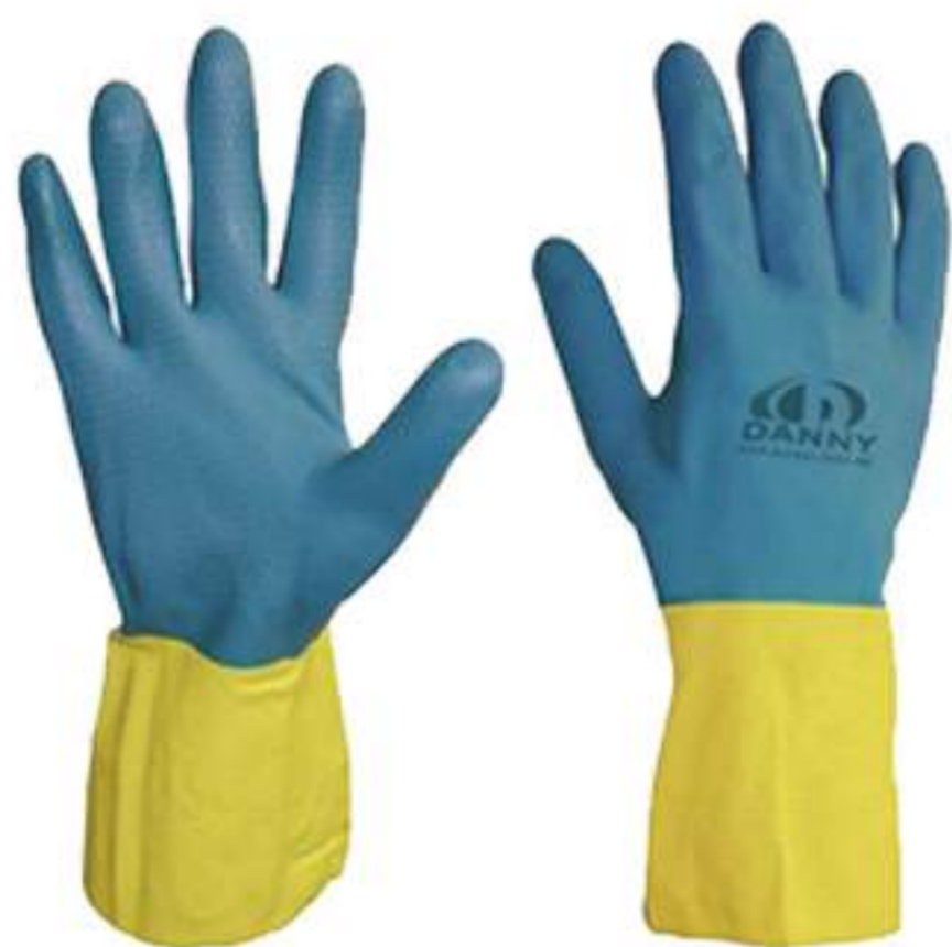
Luva Danny Neolátex CA 5774