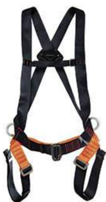
Cinturão MG Cinto 1885A