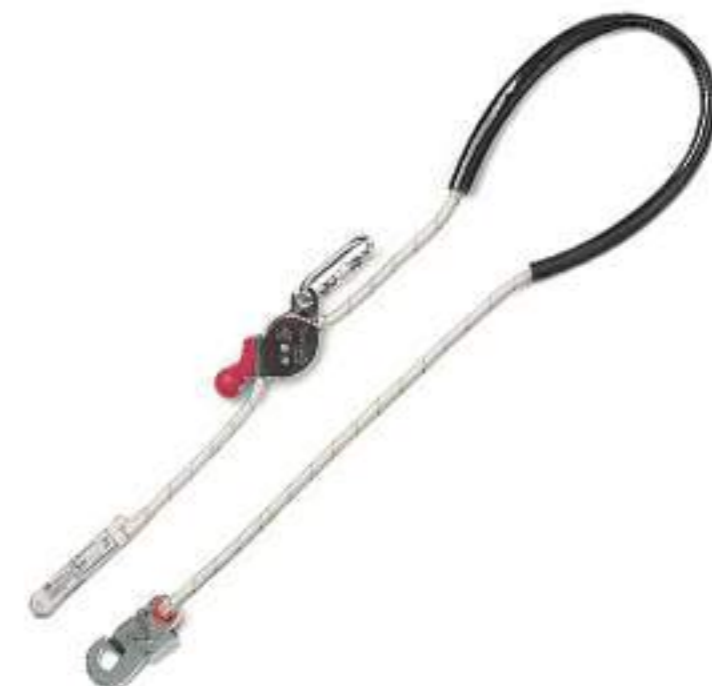
Talabarte Mult 0004 MG Cinto