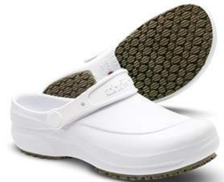
Babush BB60 Branco Soft Works CA 27921