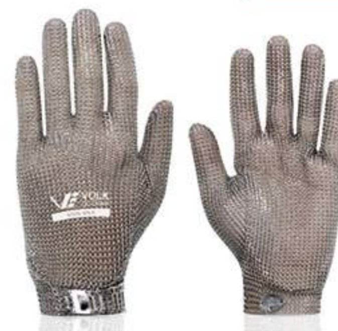
Luva Volk Malha de Aço CA 26967