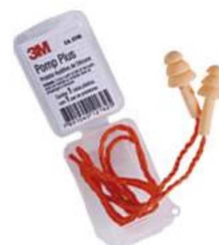
Protetor Auricular 3M Pomp Plus