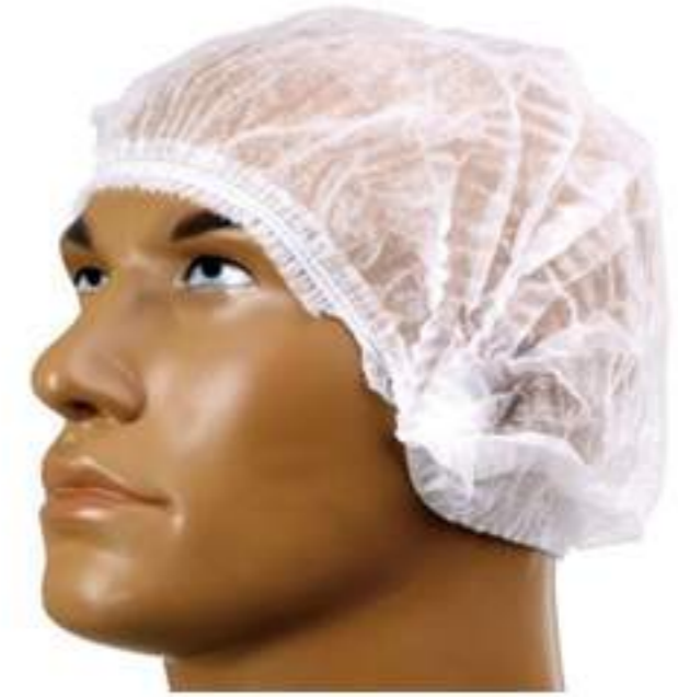
Touca TNT Descartável