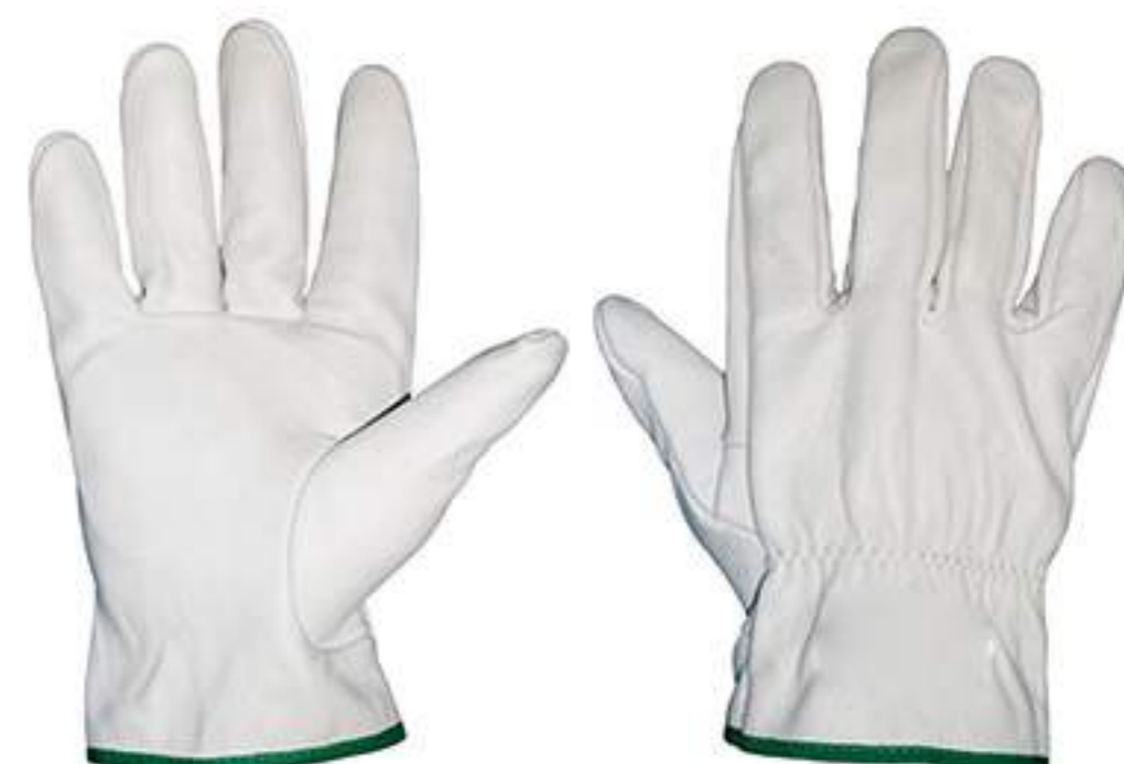
Luva de Vaqueta punho 7