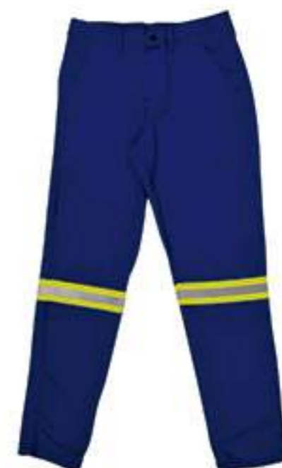
Calça NR-10 Azul com OU sem Refletivo