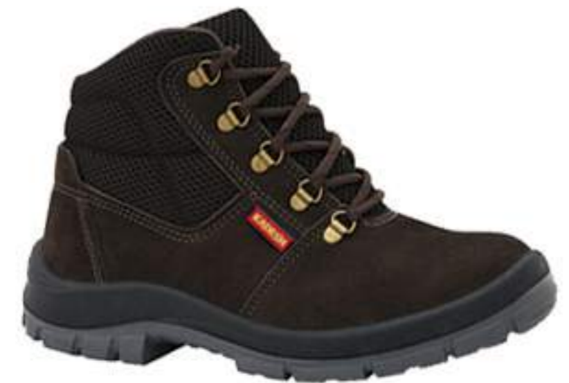
Botina Kadesh Nobuck Marrom CA 16252