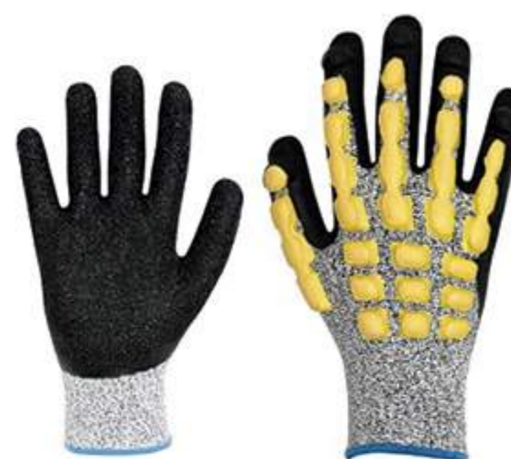
Luva Volk Impacto Cut CA 38654