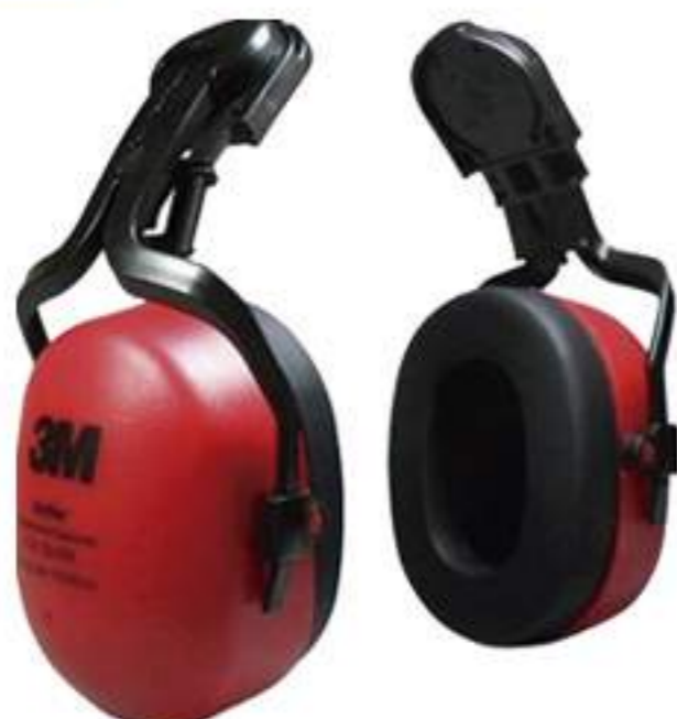
Abafador 3M Muffler para capacete