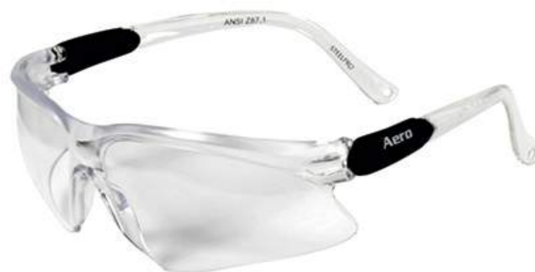
Óculos Vicsa Aero CA 20716