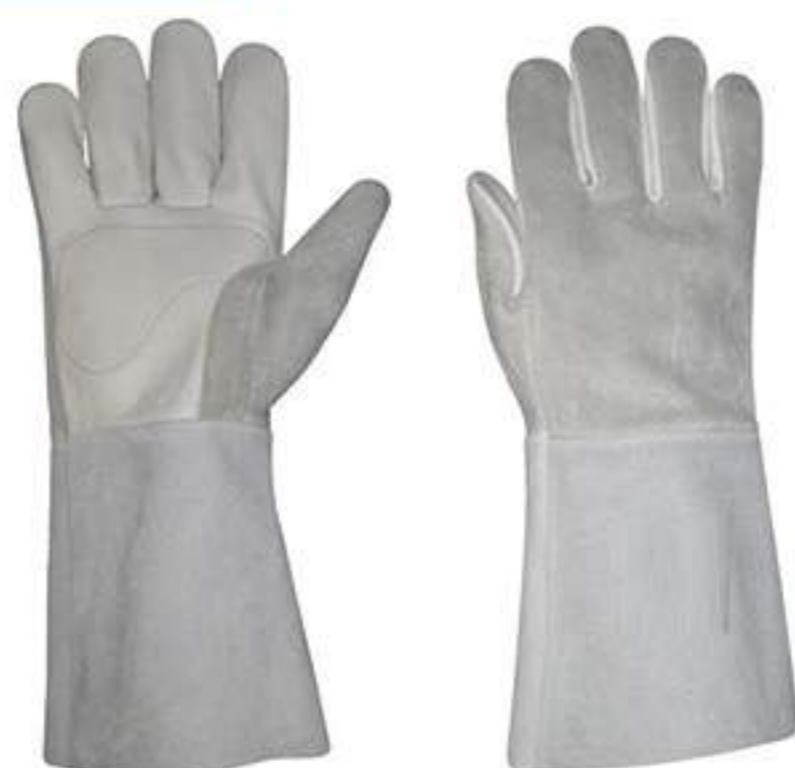
Luva de Vaqueta Mista punho 15