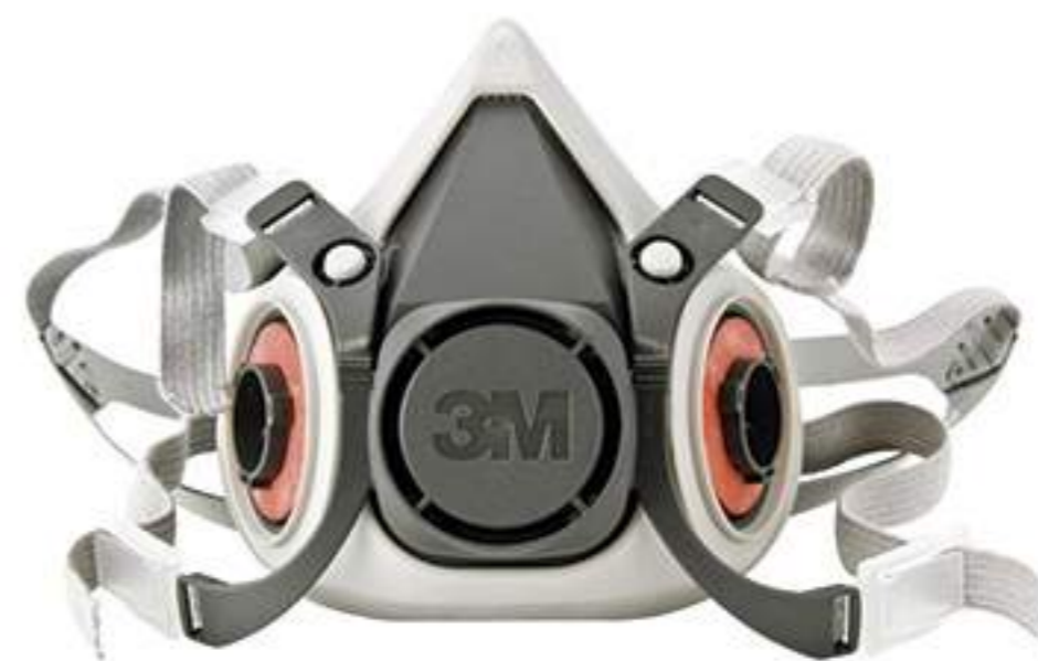
Respirador Semi-Facial 3M Linha 6000