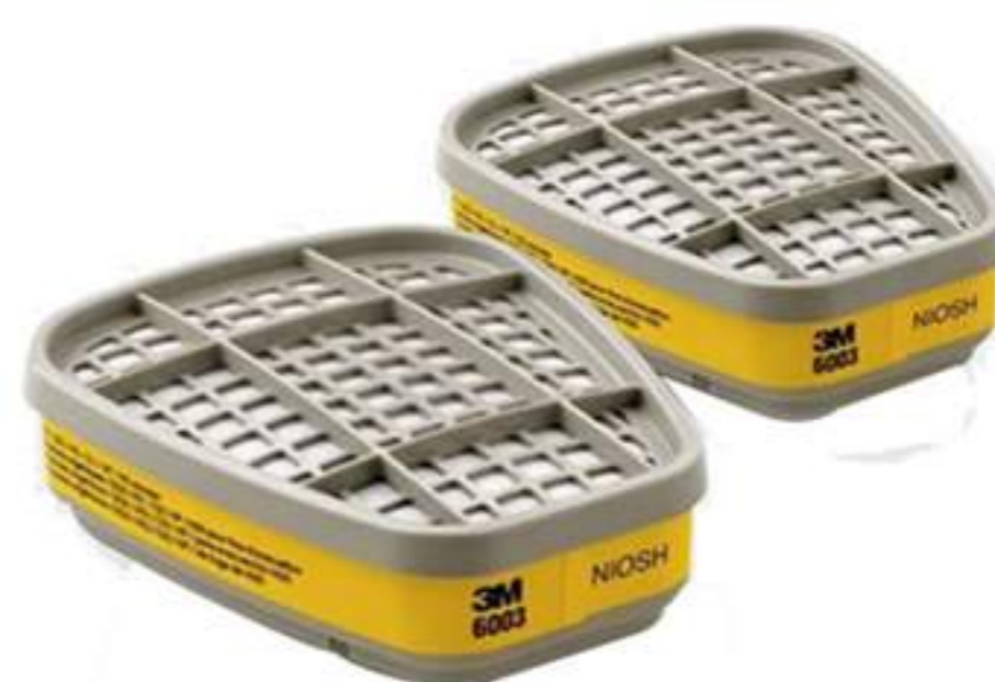
Cartuchos Químicos 3M Linha 6000