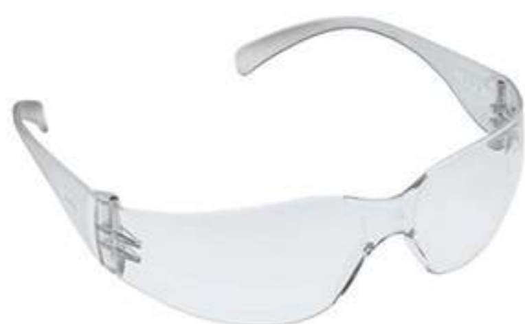
Óculos Delta Plus Summer Incolor CA 19176