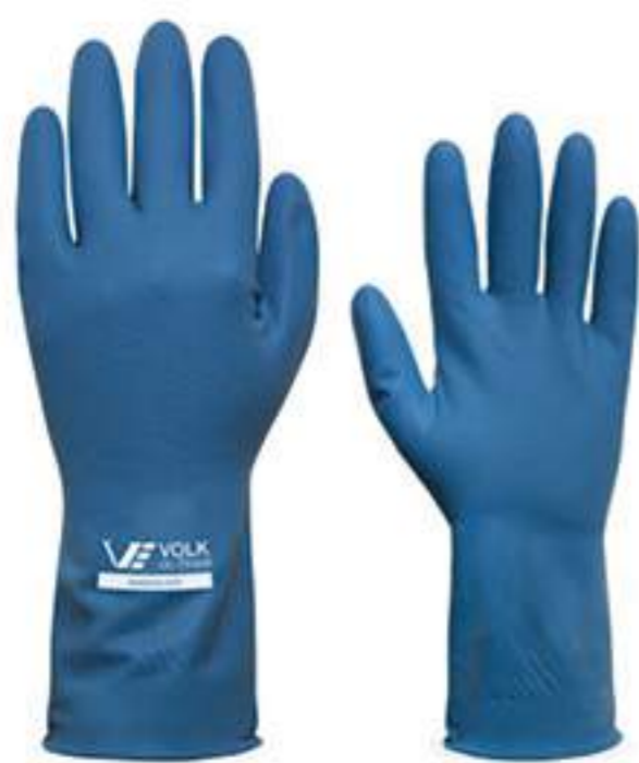
Luva Volk Ambisilver AZ CA 32290