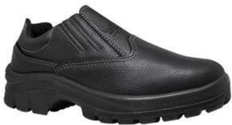
Sapato Fox CA 30303