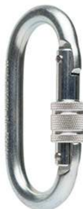
Mosquetão Simples MG Cinto