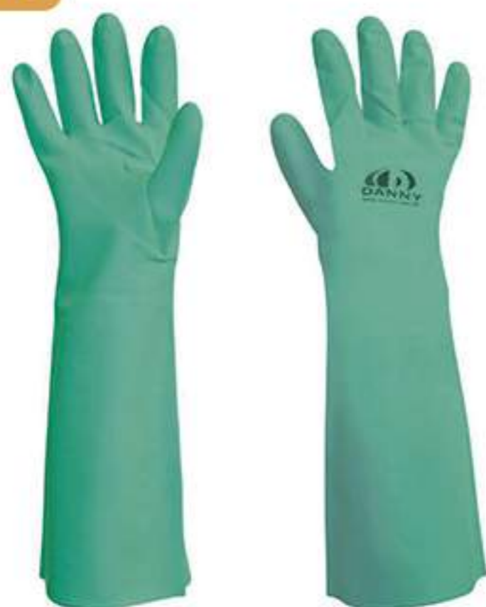
Luva Danny Nitriflex Longa CA 12254