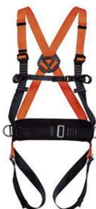
Cinturão Mult 2010 MG Cinto