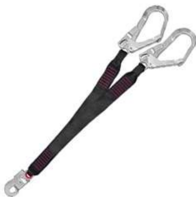
Talabarte MG Cinto 1894A