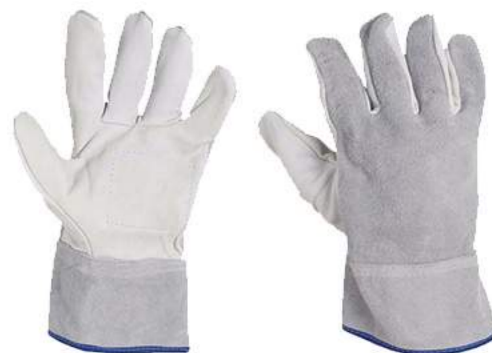
Luva de Vaqueta Mista punho 7