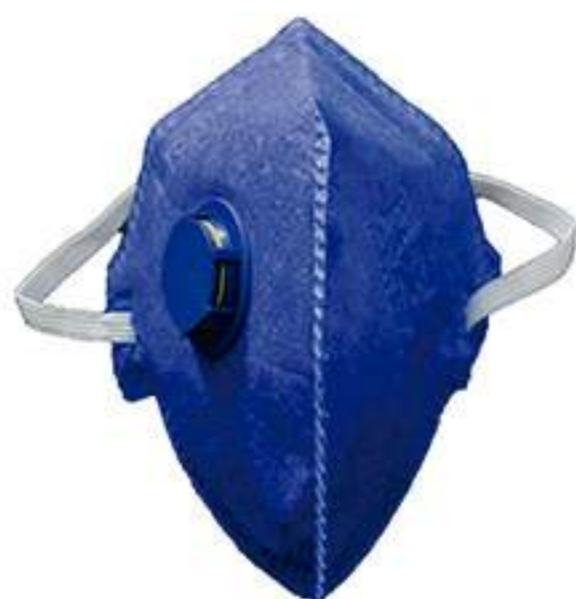
Respirador Deltaplus PFF2V