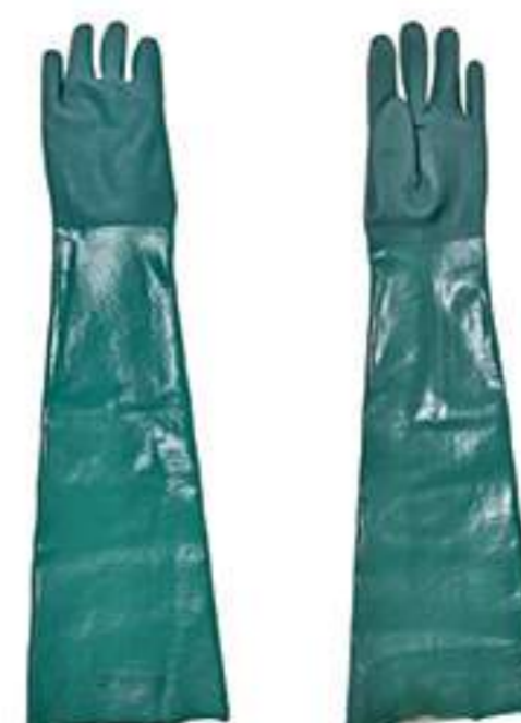
Luva Plastcor PVC 70cm