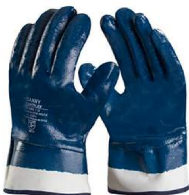
Luva Danny Lightflex Total Punho de Segurança CA 35442