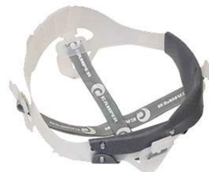
Suspensão de Tecido Camper