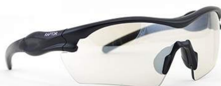
Óculos Vicsa Raptor CA 27774