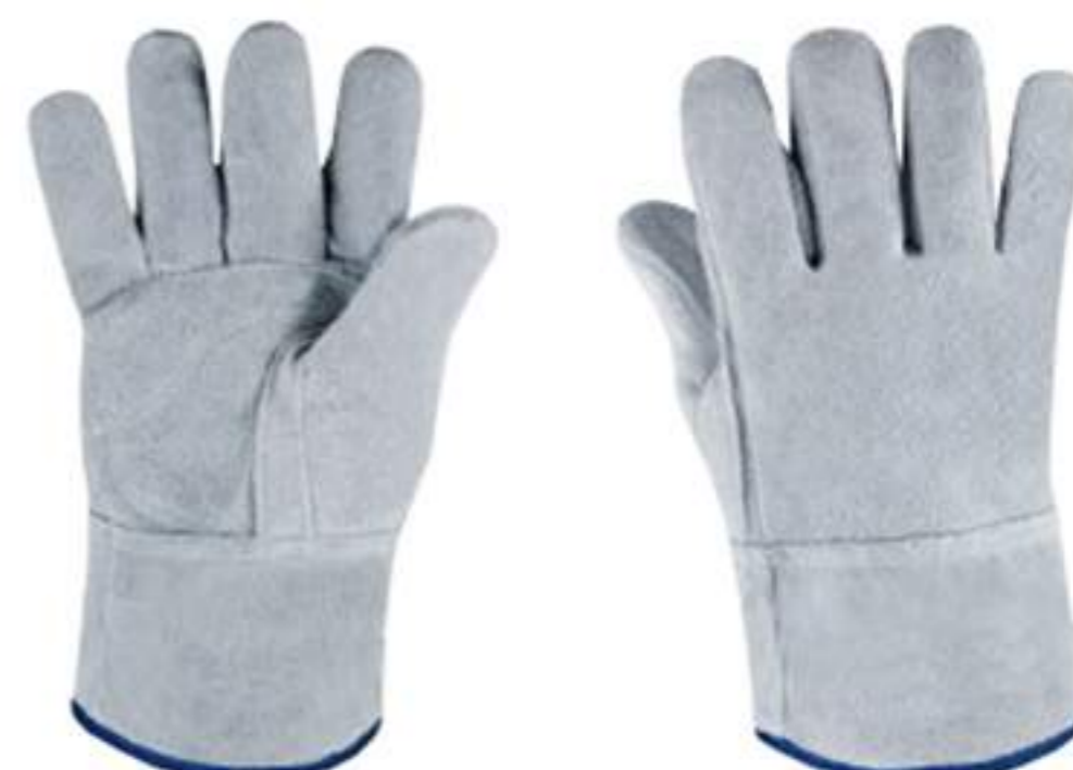
Luvas de Raspa punho 7