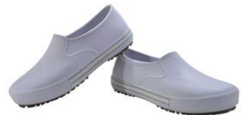
Tênis BB80 BC-PT-AZ Soft Works CA 37212