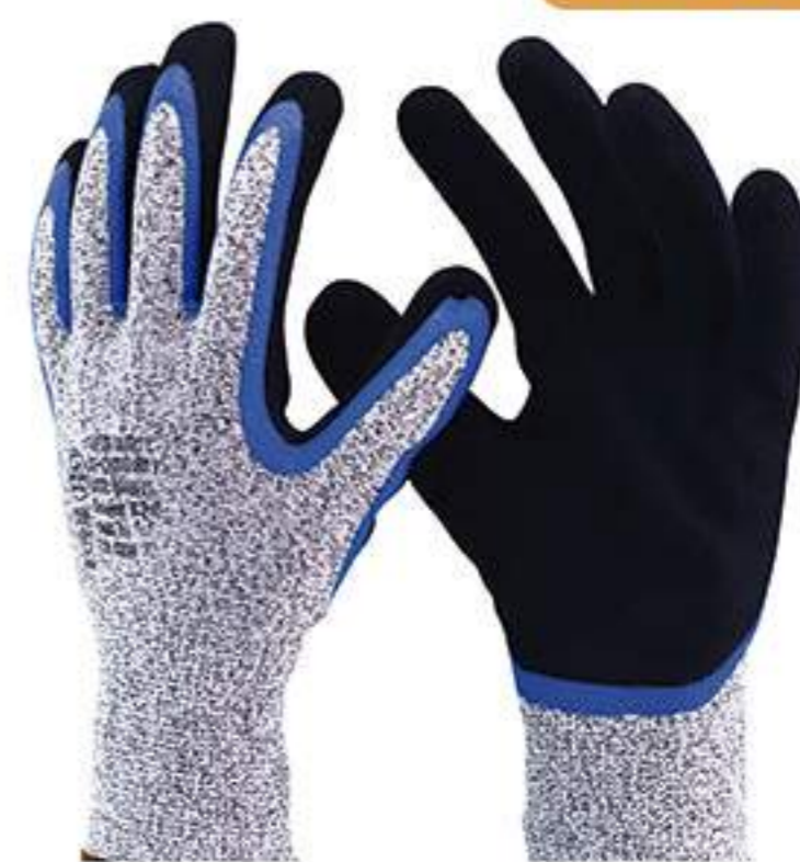
Luva SS 1007 N