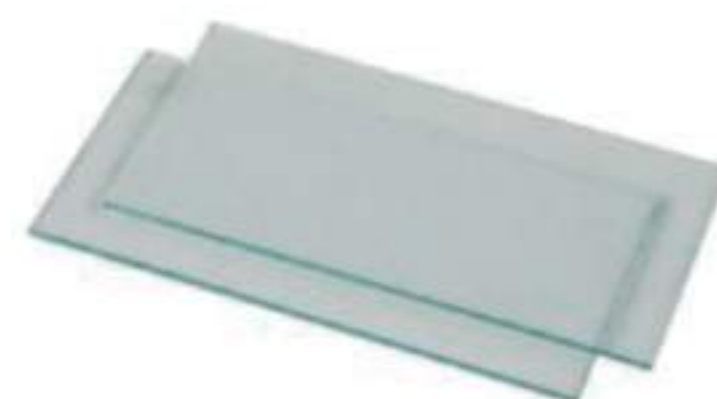
Vidro Retangular Carbografite