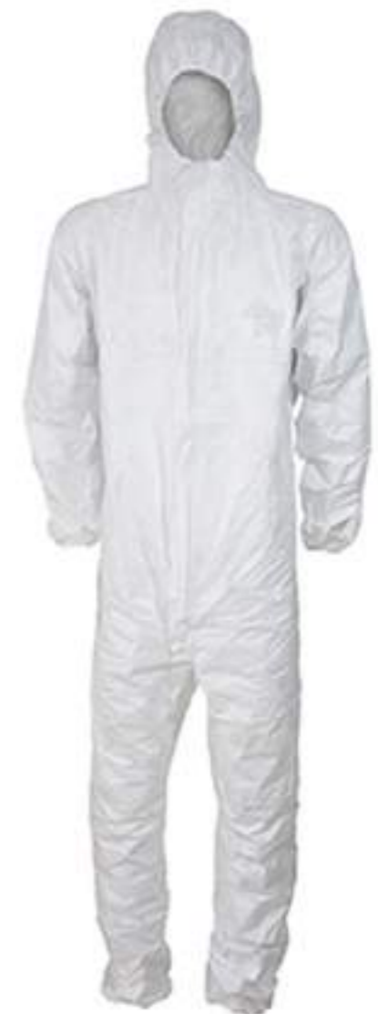
Macacão Covertech Volk CA 39183