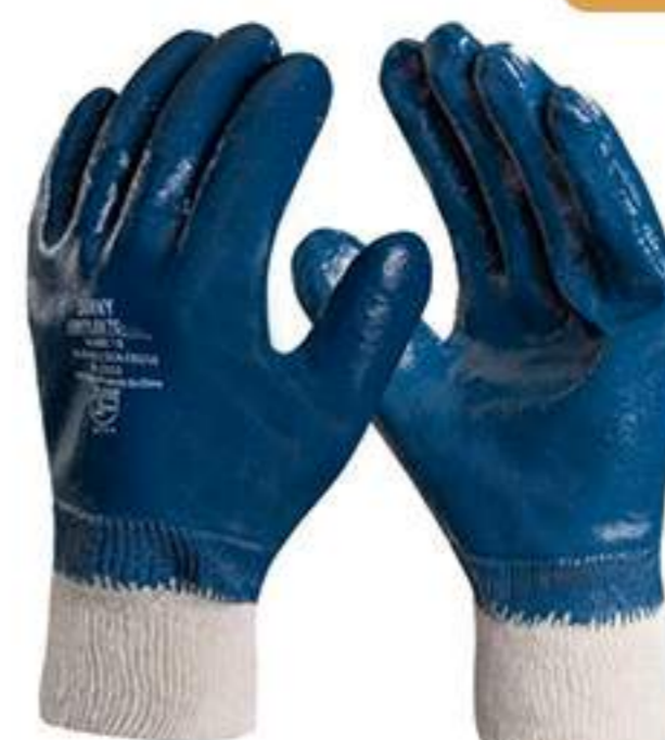
Luva Danny Lightflex Total CA 35441