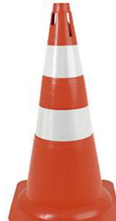
Cone 75 cm LJ-BC Flexível com Refletivo