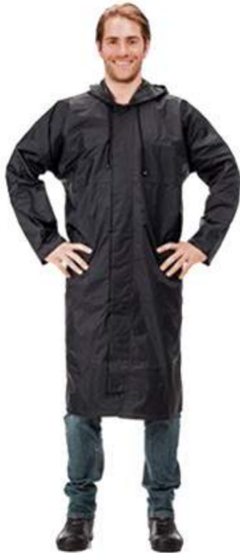
Capa de Chuva Longa Preta CA 28122