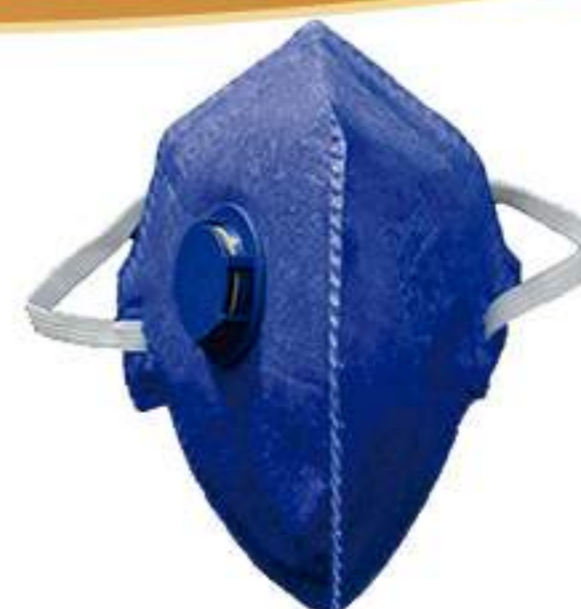
Respirador Deltaplus PFF1V