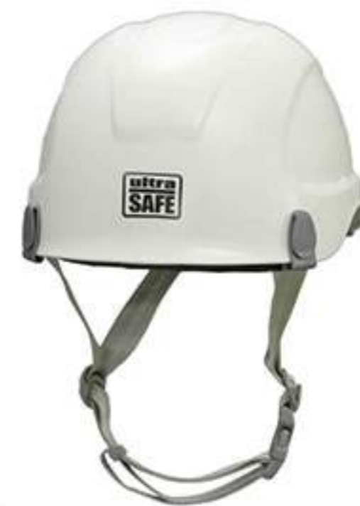
Capacete Corazza Pro CA 31158