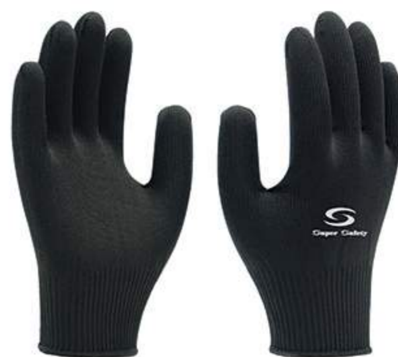
Luva SS 1003