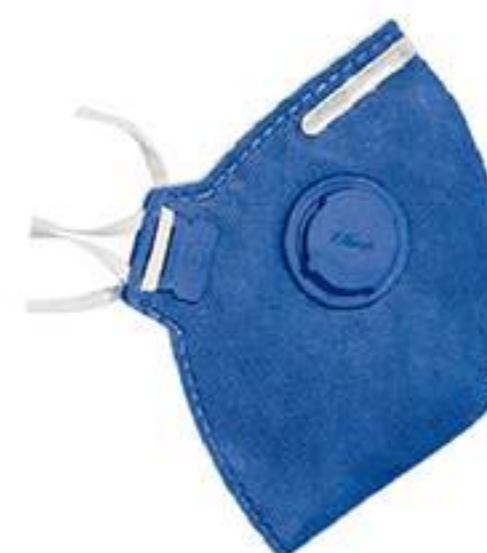
Respirador Tayco PFF1-V