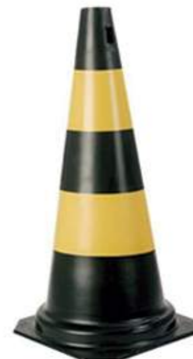
Cone 50 cm PT-AM Rígido