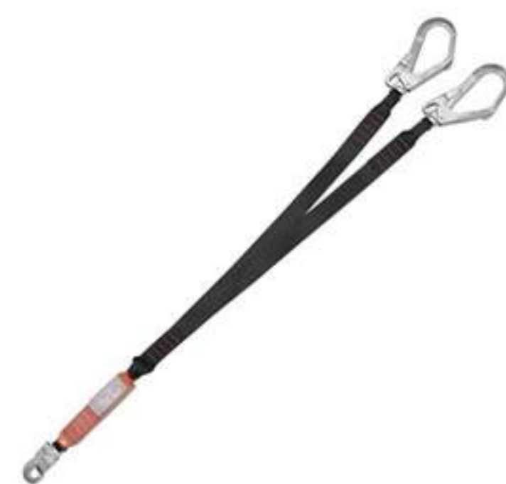
Talabarte MG Cinto 1892G