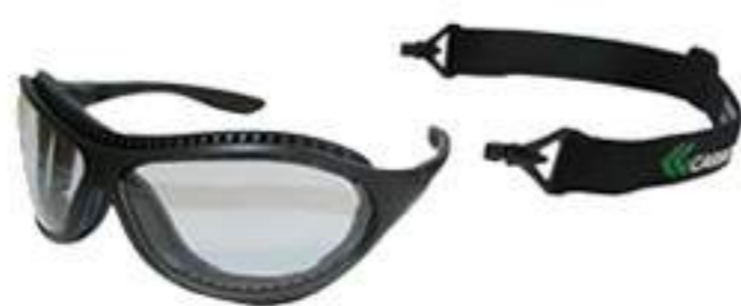
Óculos Carbografite Spyder