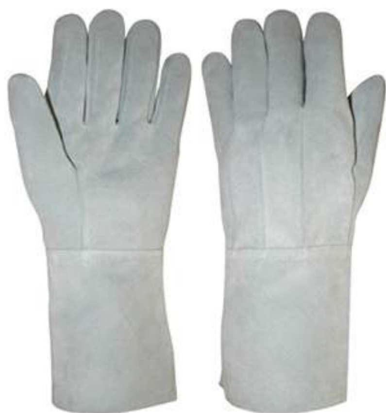
Luva de Raspa punho 15