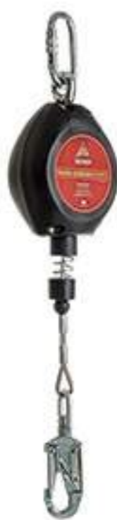
Travaquedas Mult 2016C MG Cinto