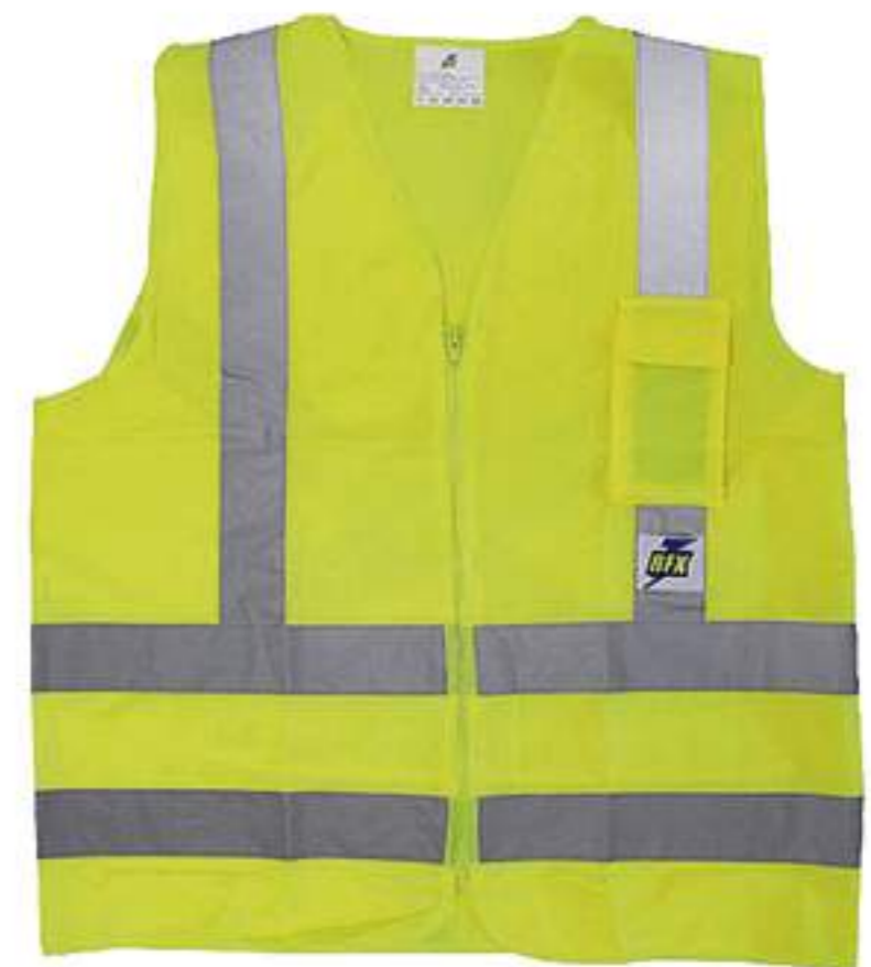
Colete Refletivo 1 Bolso VD