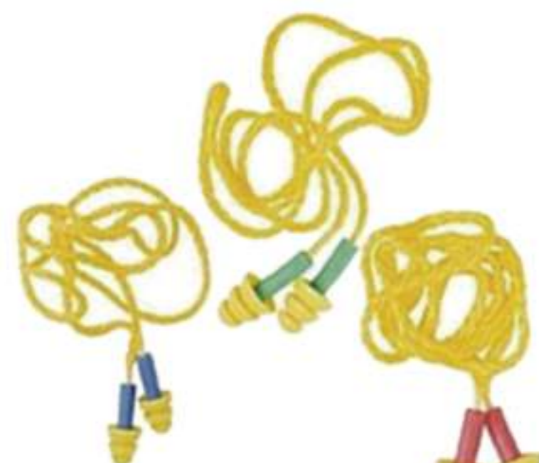
Protetor Auricular 3M Millenium