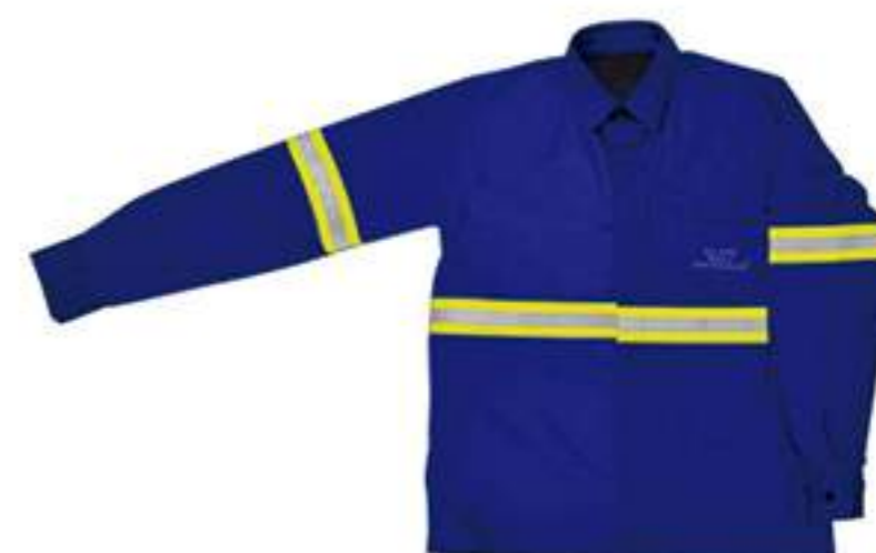
Camisa NR-10 com OU sem Refletivo Azul