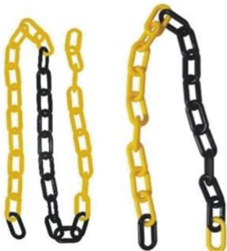
Corrente Plástica PT-AM