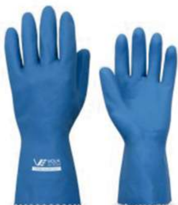
Luva Volk Látex Verniz Silver CA 16312