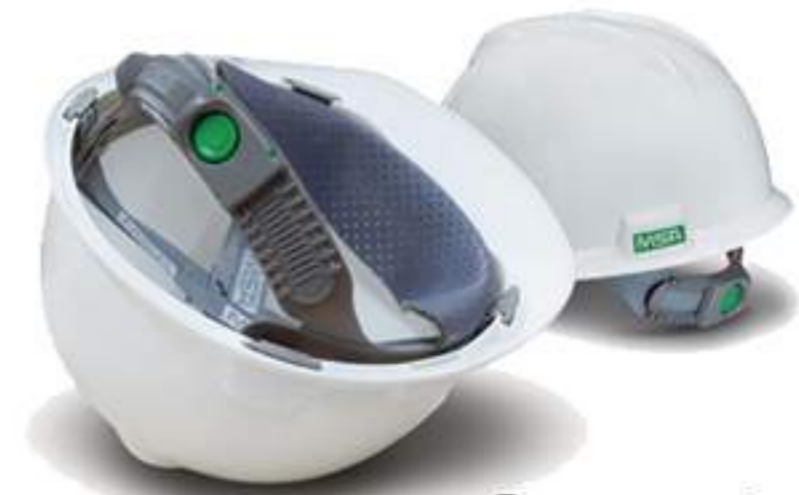
Capacete MSA CA 498