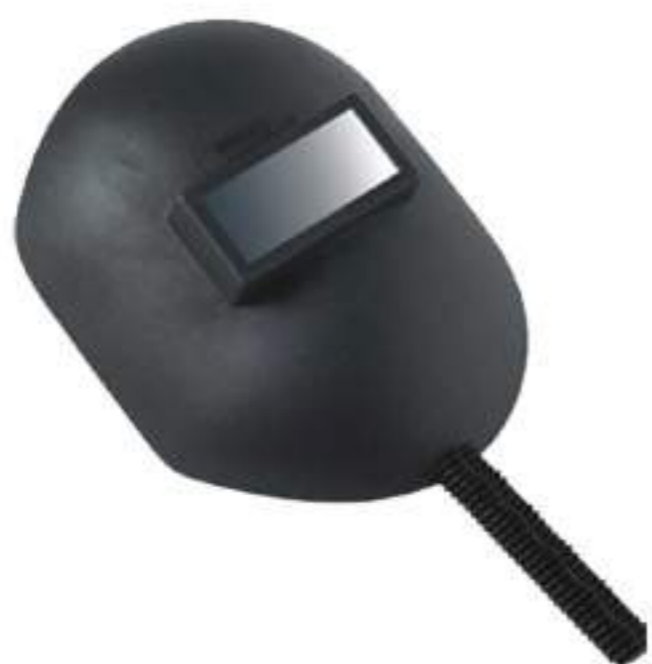
Escudo Advanced Carbografite