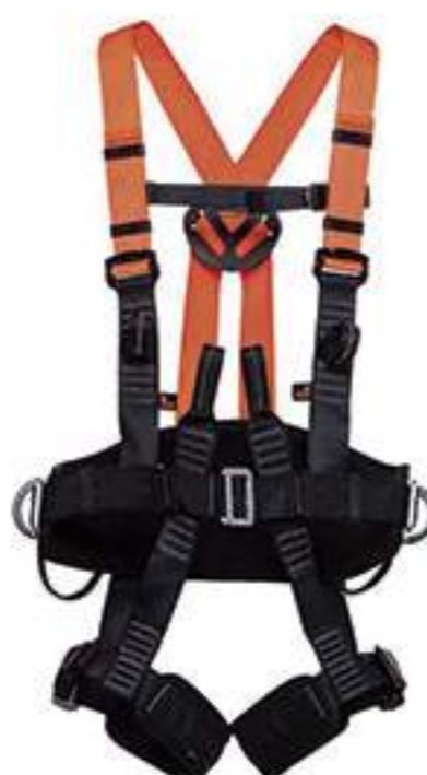
Cinturão Mult 1891 MG Cinto