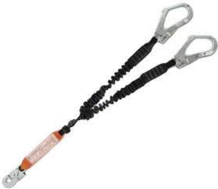
Talabarte Mult 1892 MG Cinto