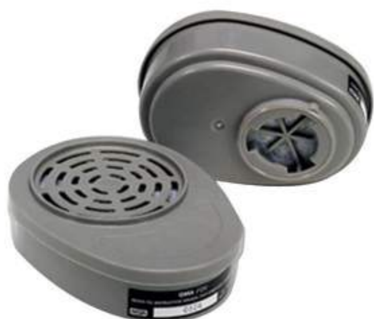
Cartucho Químico Baioneta MSA Linha 2182