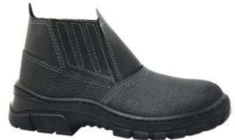
Botina Imbiseq Monodensidade CA 17015