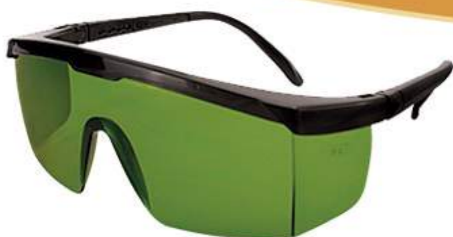
Óculos Danny Fênix Verde CA 2722