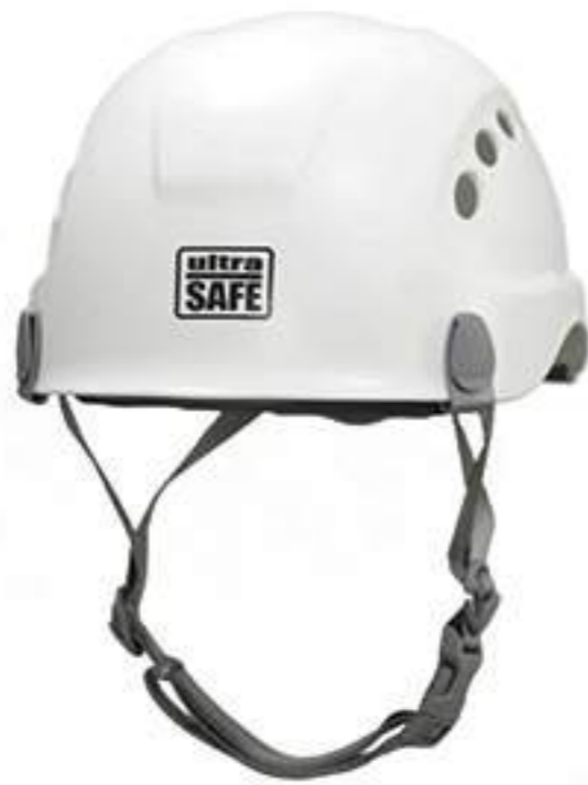
Capacete Corazza Air CA 31159