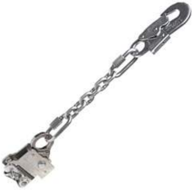
Travaquedas Mult 1887 MG Cinto