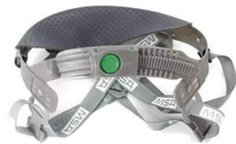
Suspensão com jugular push to key MSA