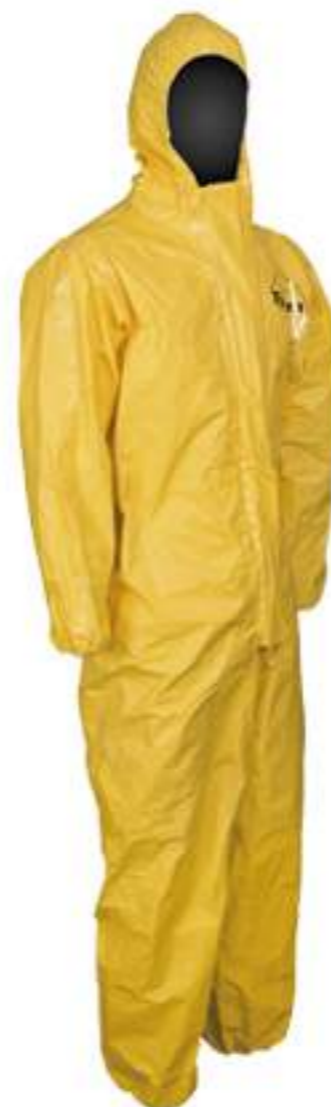
Macacão Tychem QC DuPont CA 38647