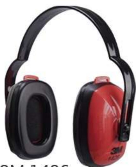
Abafador 3M 1426