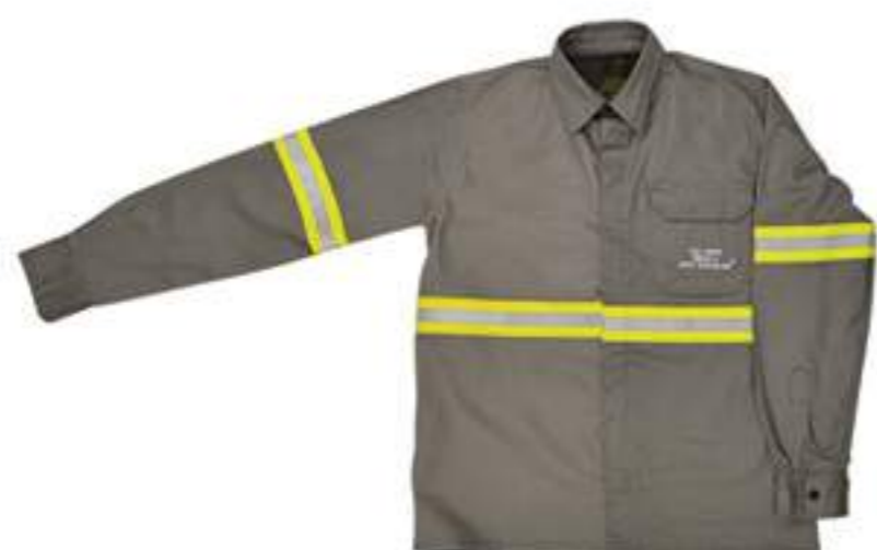
Camisa NR-10 com OU sem Refletivo Cinza