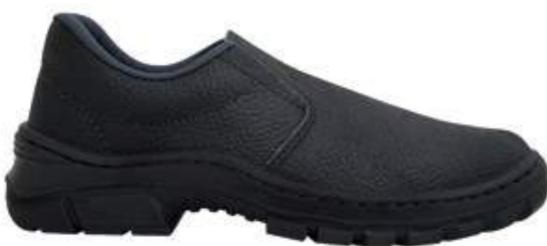
Sapato Imbiseq Monodensidade CA 16571