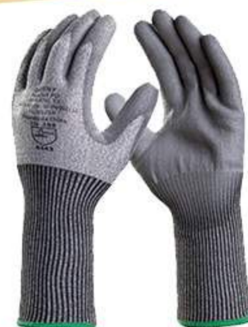
Luva Danny Flexcut PU CA 33997