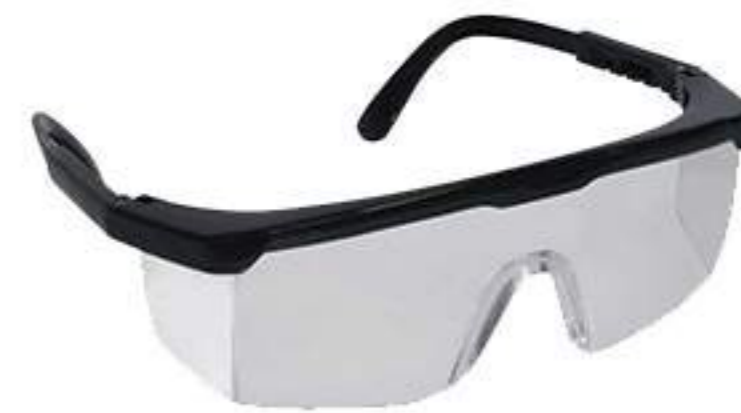
Óculos Danny Fênix Incolor