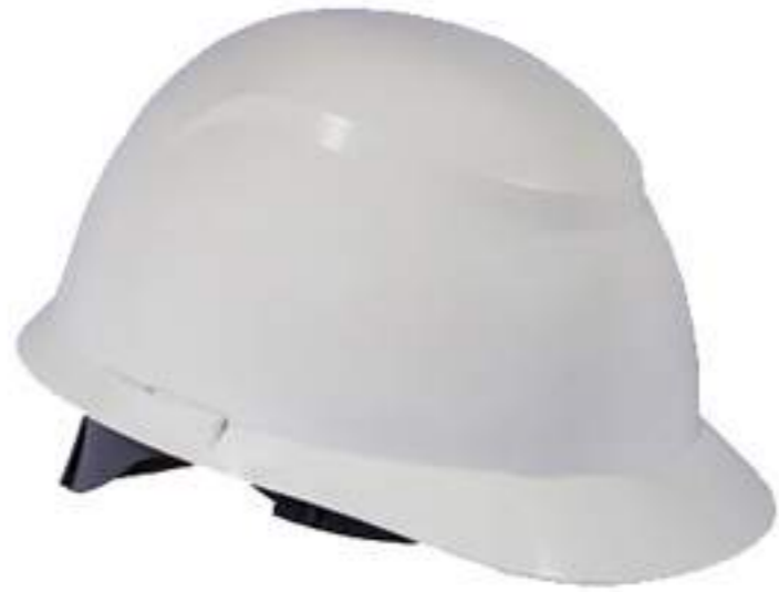
Capacete Camper CA 34414