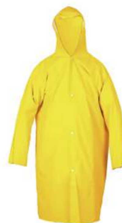
Capa de Chuva