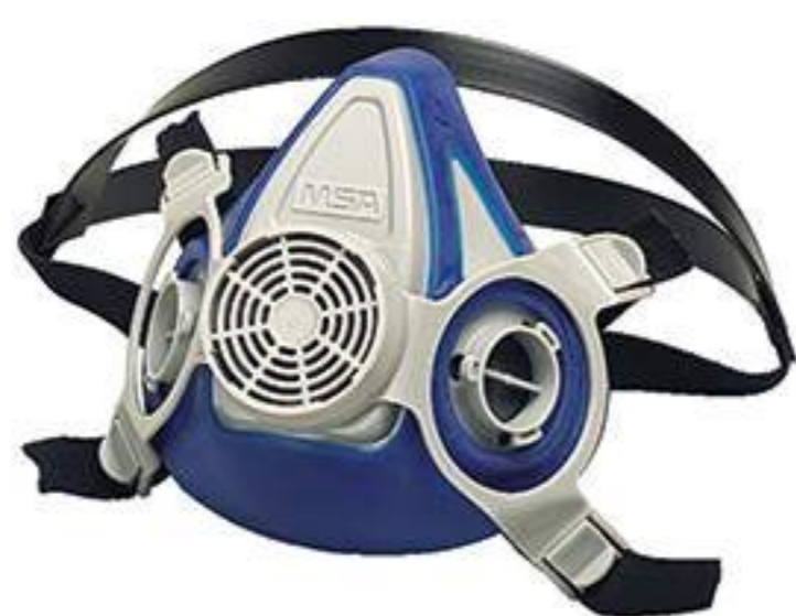
Respirador Semi-Facial Advantage MSA