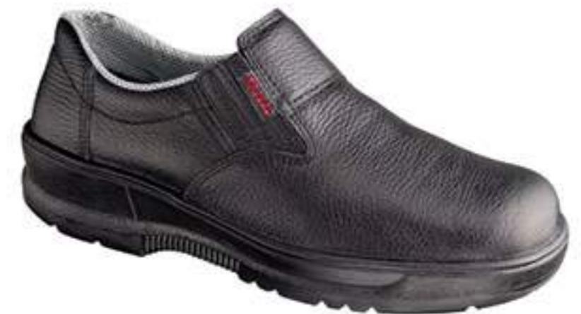
Sapato Conforto CA 9128