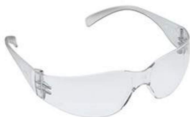
Óculos Danny Águia Incolor