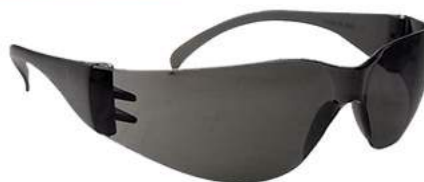
Óculos Delta Plus Summer Fumê CA 19176