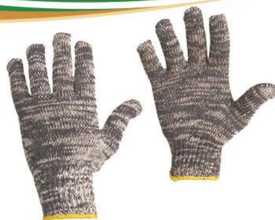
Luva de Malha 4 Fios Mescla CA