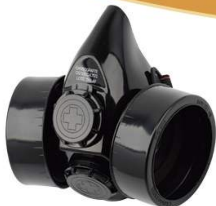
Respirador Carbografite CG306