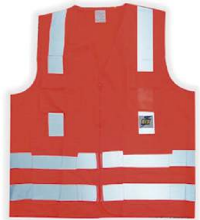
Colete Refletivo 1 Bolso LJ