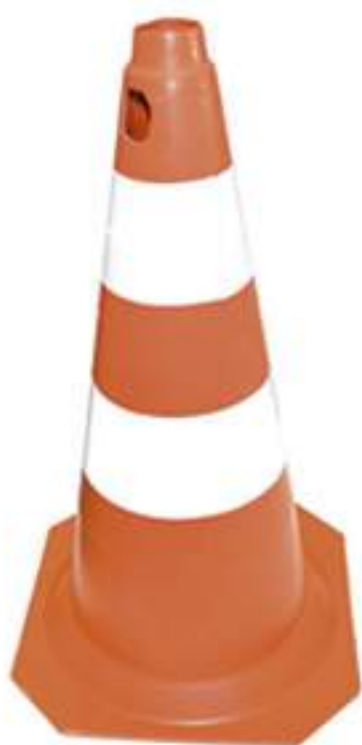
Cone 50 cm LJ-BC Rígido